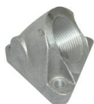
Pripojovací konektor AUC