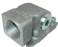
Pripojovací konektor ARC

Polohu pripojovacích otvorov je možné zvoliť zo 4 rôznych polôh (Na vstupy Ø30 sa namontujú 2 pripojovacie konektory a 2 uzatváracie príruby). V každej polohe je ešte možné natočenie pripojovacieho konektora do 4 smerov po 90°.